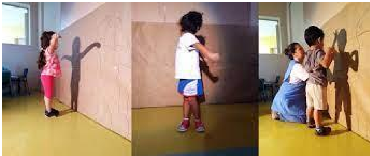
GRÁFICO DAS SOMBAS